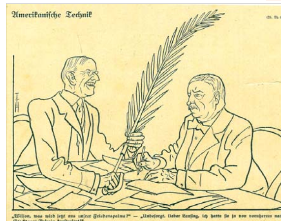
Der Karikaturist erkennt Wilsons Politik und hält mit knappen Strichen die drohende Wirklichkeit fest.

In dieser Gesamtlage kam das deutsche Angebot vom 12. Dezember 1916 zu Friedensgesprächen ohne Vorbedingungen. 21 Dieses wurde bei den Bevölkerungen der neutralen Länder, aber auch in den Entente-Staaten überwiegend positiv aufgenommen. Für Deutschland war dieser Schritt aber problematisch. Die so deutlich bekundete Bereitschaft, trotz der gebrachten Opfer und der relativ günstigen militärischen Lage Frieden zu schließen, offenbarte Schwäche und schwindende Siegesgewissheit. Die Weihnachtsfeiertage abgerechnet, brauchten England und Frankreich kaum zehn Tage, um das Angebot mit