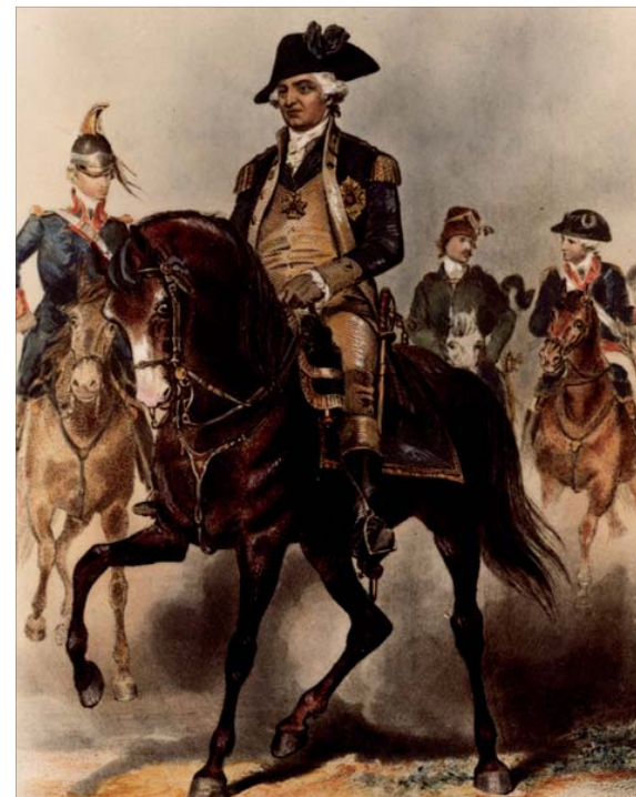
General Friedrich Wilhelm von Steuben war im Kontinentalkrieg gegen England auf Seiten der Vereinigten Staaten im Einsatz. Die 1957 erstmals durchgeführte Steubenparade in New York erinnert jährlich an den großen deutsch-amerikanischen Soldaten des 18. Jahrhunderts

Es kam nun die Stunde der USA. Zwar konnten nun Truppen von der Ostfront in den Westen verlegt werden, aber die aus USA kommenden Verstärkungen verhinderten deutsche Durchbruchversuche. Im Juni 1917 standen erst 14.000 US-Soldaten in Frankreich, doch bis Mai 1918 waren es schon eine Million und Anfang November etwa zwei. Der Krieg verlief