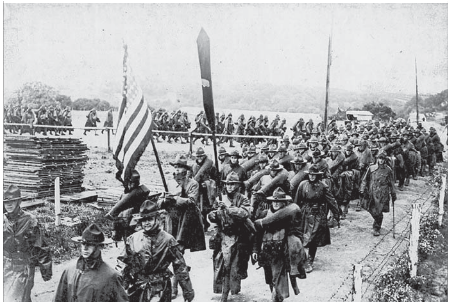
Schon wenige Monate nach der Kriegserklärung an das Deutsche Reich landeten erste US-Truppenkontingente in Frankreich.

Was im Falle eines deutschen Sieges zu befürchten war, stand umgekehrt als glänzender Siegespreis vor den Augen des amerikanischen Volkes. Ein Sieg der USA über Deutschland würde die Vorherrschaft der USA über die Entente-Mächte und damit die Weltherrschaft bedeuten – ein sacro egoismo auf Weltniveau. Die ersten Sätze des 14 – Punkte – Programms vom 8. Januar 1918 des US – Präsidenten Wilson deuten das an: